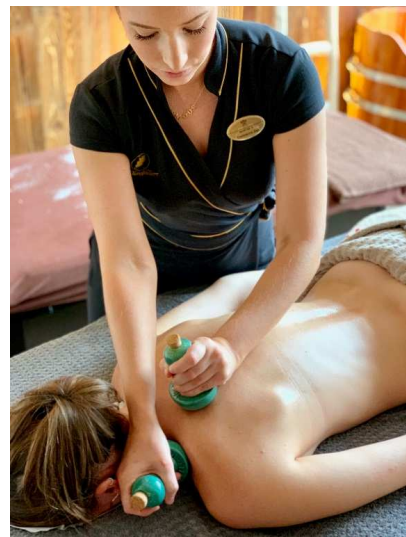
Abbildung: "Renaissance sublimée"-Behandlung (Foto vor Covid aufgenommen)

Feilen der Nägel, Nagelhaut wird hydratisiert und zurückgedrängt, Wellness-Massage, Auftragen einer stärkenden Grundierung.